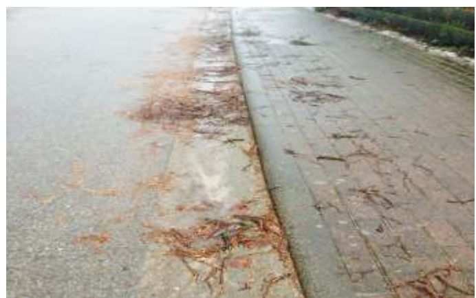
Tagelang, manchmal Wochenlang nicht gereinigt. Zwangsläufig landet alles im Regenwasserkanal.

Ich muss auch heute wieder eine kritische Bemerkung an einige Bürgerinnen und Bürger richten: Es fällt auf, dass die im wesentlichen seit 2002 gültige Straßenreinigungssatzung teilweise nicht eingehalten wird. Ich bitte Sie, ihren entsprechenden Pflichten nach zu kommen.